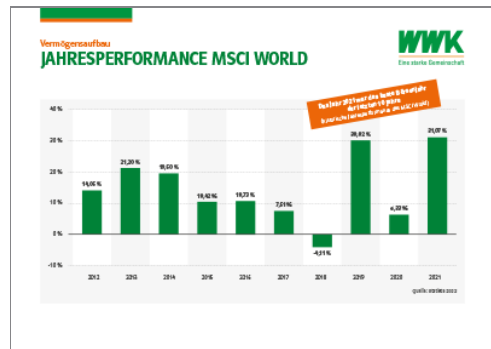
Jahresperformance MSCI World